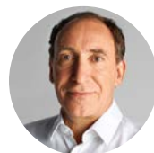
Johannes Rauch , Bundesminister für Soziales, Gesundheit, Pflege und Konsumentenschutz